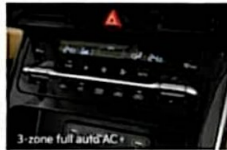
3-zone full auto AC