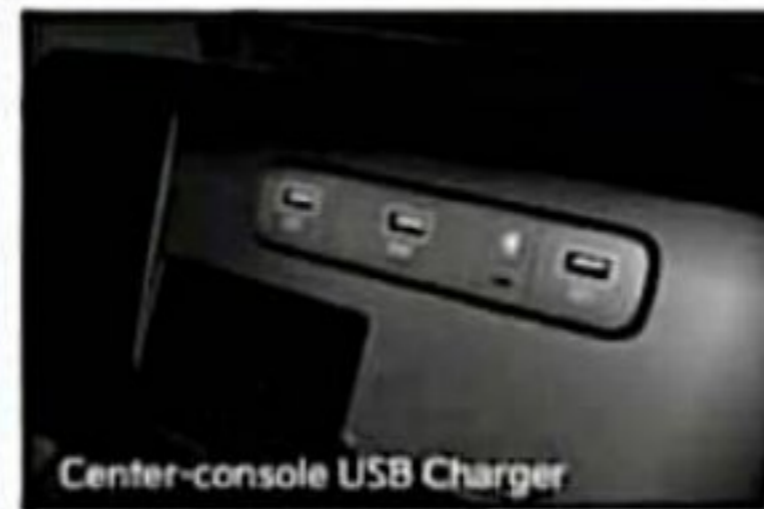
Center-console USB Charger