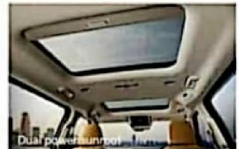
Dual power sunroof