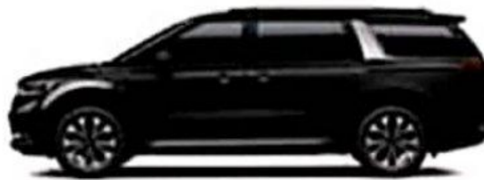
Aurora Black Pearl