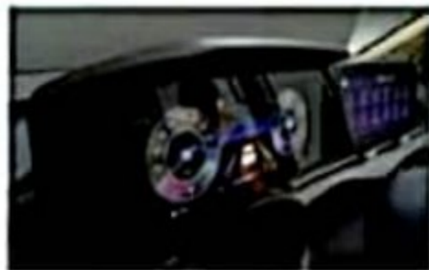
12.3 Inch Digital Cluster