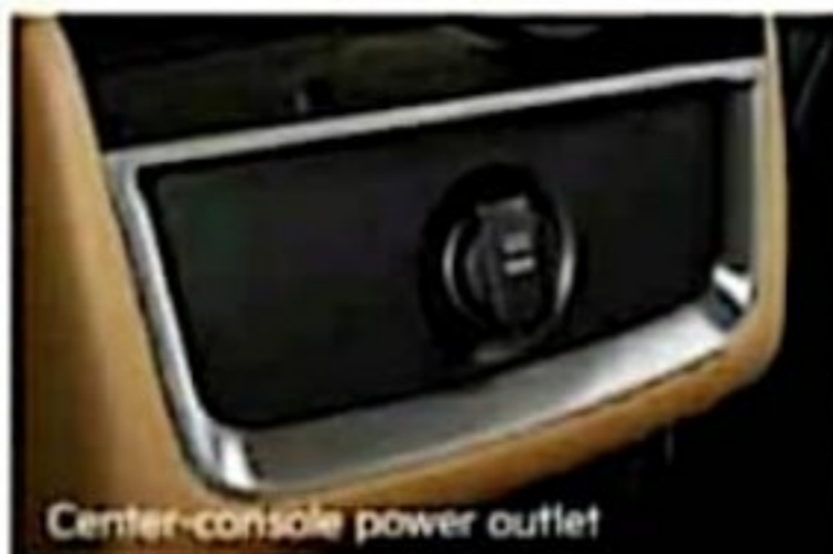
Center-console power outlet