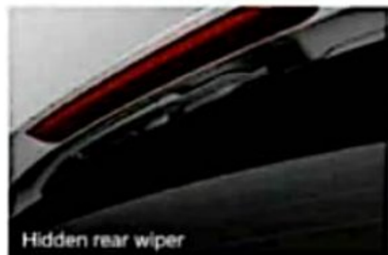
Hidden rear wiper