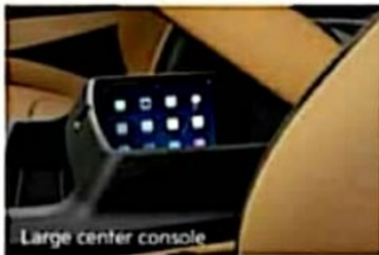
Large center console