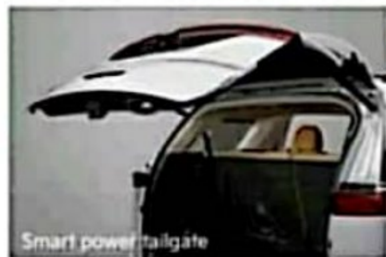
Smart power tailgate