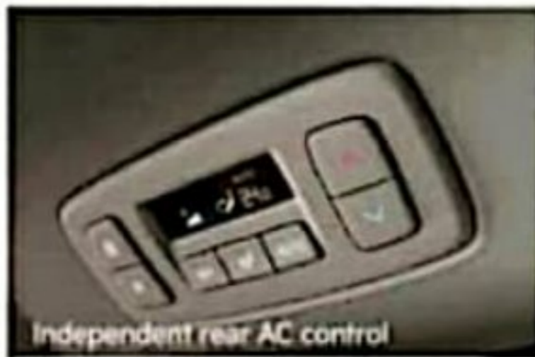
Independent rear AC control