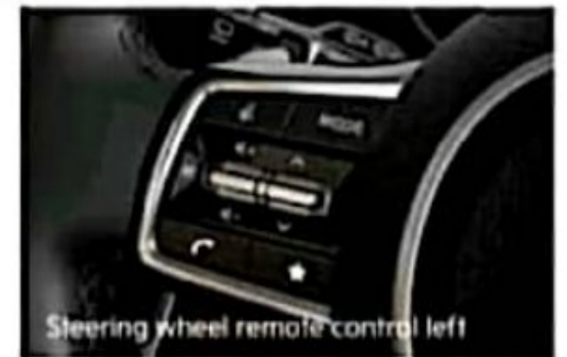
Steering wheel remote control left