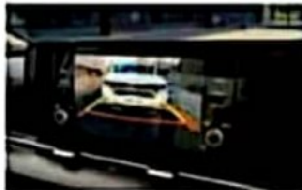
Surround View Monitor