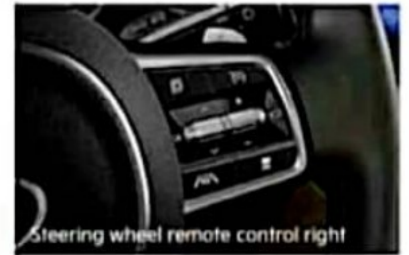
Steering wheel remote control right