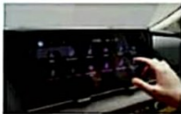
12.3 Inch Head Unit