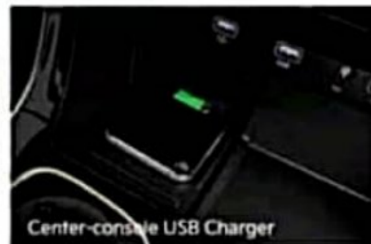
Center-console USB Charger