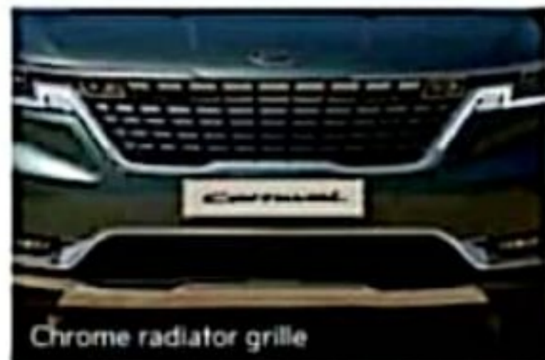
Chrome radiator grille