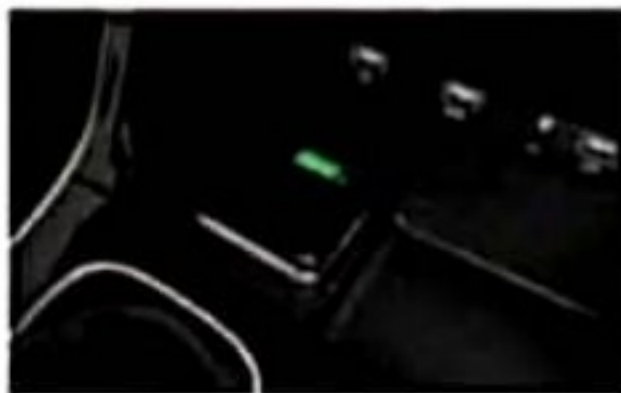
Smartphone Wireless Charger