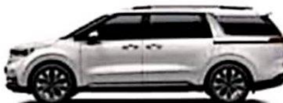
Snow White Pearl